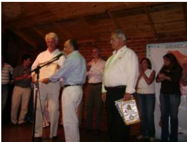
Entrega de Carta Constitutiva a RC Benavidez