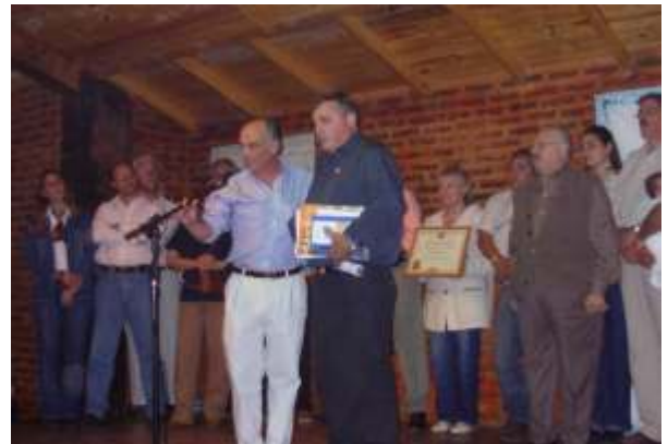
Entrega de Carta Constitutiva a RC Parada Robles

Ahora solo nos queda trabajar para la comunidad y que puedan ser el vínculo entre las necesidades y las posibilidades de hacer los sueños realidad. Dos nuevos clubes se sumaron a la gran familia rotaria esperando servir para que la rueda siga girando con el solo fin de extender nuestra mano solidaria a quienes más lo necesitan.