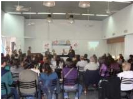
Seminario de Nuevas Generaciones

Queridos amigos: El 27 de setiembre hemos concluido el Seminario de Nuevas Generaciones, realizado en San Nicolás, el que se ha desarrollado con todo éxito, con la participación de mas de 115 inscriptos jóvenes de Interact; Rotaract; Rotex y miembros del Programa de Intercambio de Jóvenes entrantes y salientes, una perfecta organización de parte de los Clubes Anfitriones de San Nicolás y San Nicolás Sud y sus respectivas ramas juveniles, con la participación de muy importantes disertantes externos y rotarios . Es oportuno agradecer